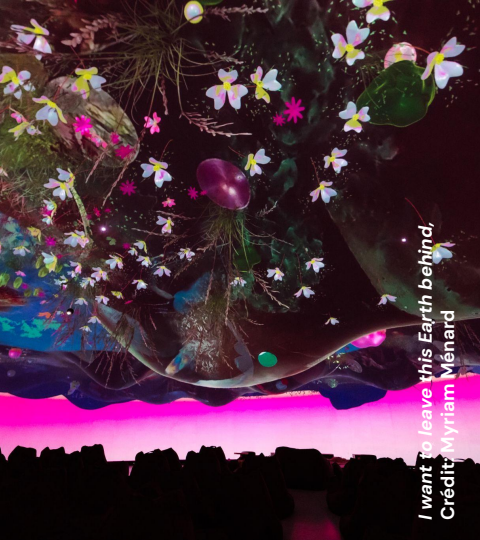
I want to leave this Earth behind.