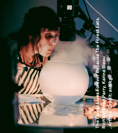
The Forest Lives Forever Because The Forest Eats, Richard Reed Parry, Karina Bleau Artiste: ash kg