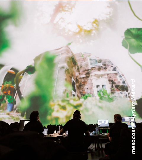
mesocosm Myriam Ménard