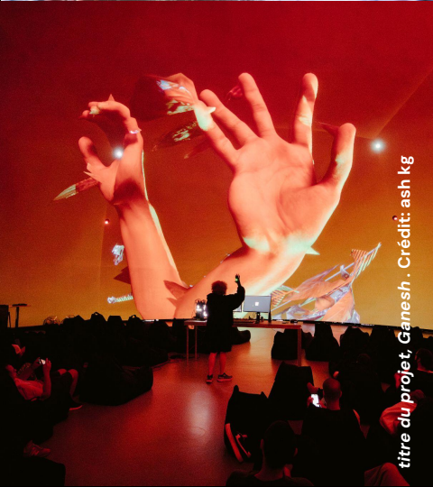
titre du projet, Ganesh . Crédit: ash kg