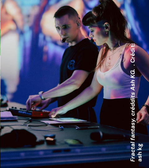
Fractal fantasy