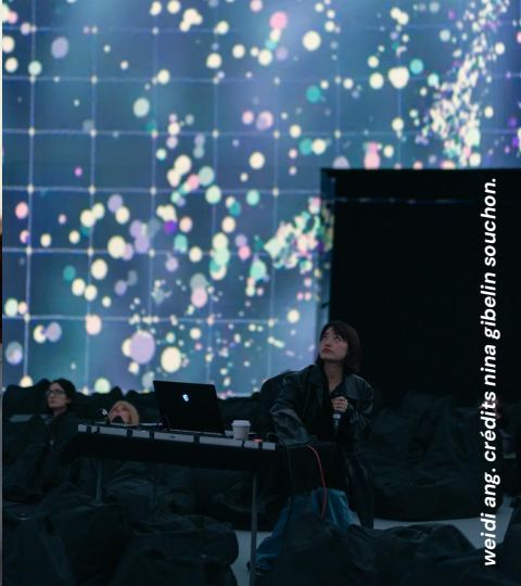
weird ang. crédits nina gibelin souchon.